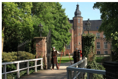
Schloss Haus Rhede